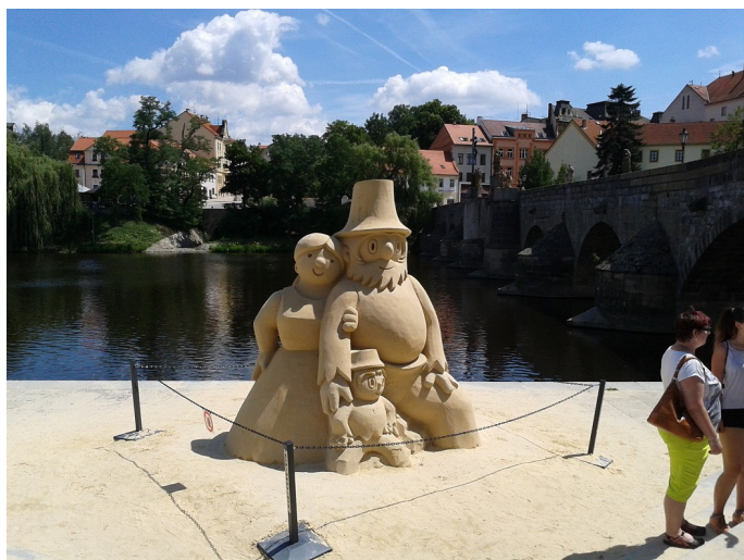
Sochy z písku v Písku 2017 - 50 let Rumcajse Cyklozájezd KČT Úpice - Vodňany 2017