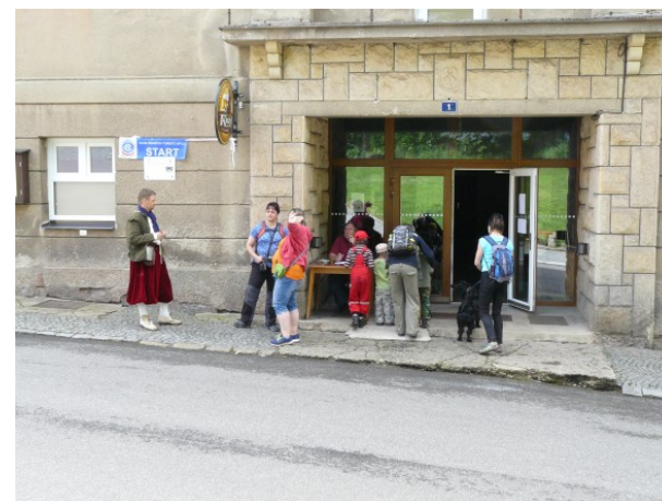
Pochod "Po stopách loupežníka Lotranda" 2017