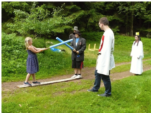
Pochod "Po stopách loupežníka Lotranda" 2017