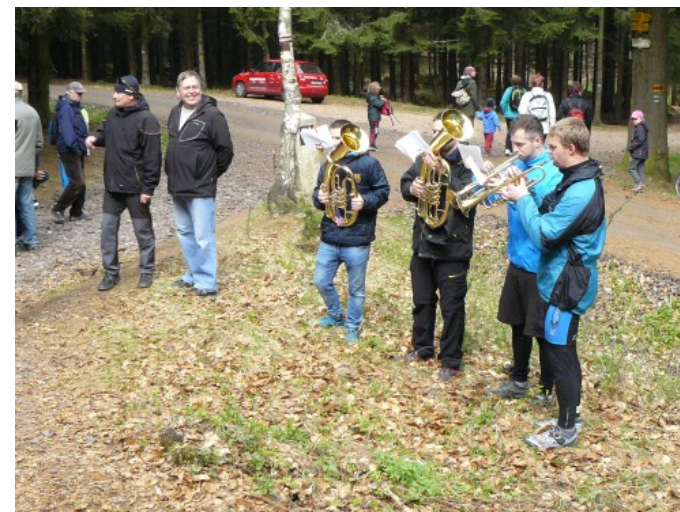
Zahájení turistické sezony v Jestřebích horách a Královéhradecké oblasti "Bílá u Bílého" v r. 2017