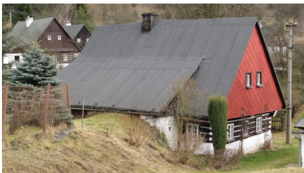
Chalupy v Radvanicích

Občerstvili jsme se, oddechli si, podebatovali a další naše kroky budou směřovat po cestě do Radvanic. Odděluje se menší skupinka, která volí trochu delší trasu, ale setkáme se opět v Radvanicích. Zpočátku je cesta zledovatělá, teplota už je nad nulou a blátíčko místy povolilo. Kráčíme lesem, kde pokácené stromy odkryly výhled na bizarní tvary kamenných bloků, které předtím oku turisty byly skryty. Před námi už je vidět radvanický kostel, jehož světlá fasáda svítí do dálky. Je otevřen hlavní vchod a tak se jdeme podívat na vnitřní uspořádání. Je to krása, umocněná výškou prostoru a tichem. Protože máme čas, navštívujeme zdejší hospůdky, ve které počkáme na druhou skupinku, abychom pak společně vyrazili ke zdejšímu nádražičku, které se nachází na kopci.