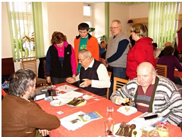
Kolega Krejcar vyřizuje úřad