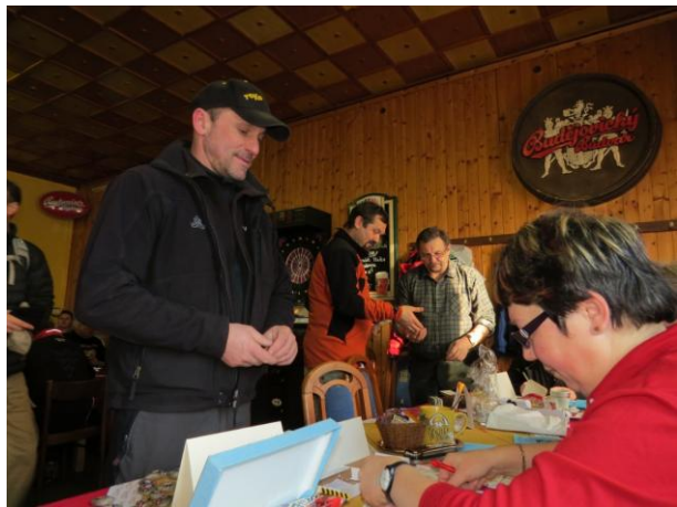
Ani mráz - 15 st. neodradil 226 pochodniku

Nastal poslední den, který i ve večerních hodinách nevěstil žádné zlepšení podmínek, stále zataženo a teplota nad nulou. Vše nasvědčovalo tomu, že smůla, která nás provázela od předloňského podzimu, se špatným a deštivým počasím v den akce, bude mít i letos pokračování. Ale i zázraky se někdy dějí.