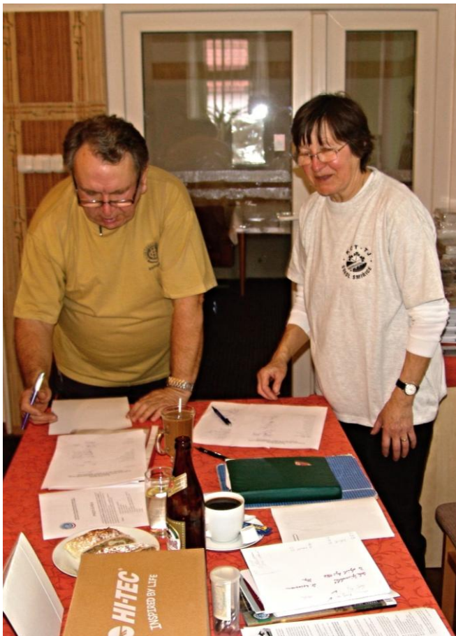
Manželé Jágrovi zajistili bezchybnou prezentaci