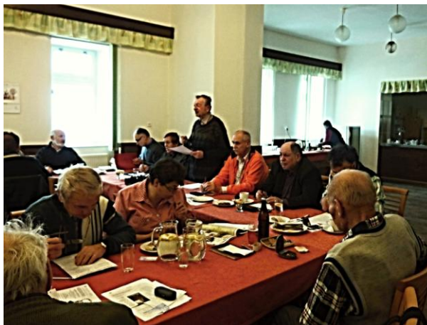
Předseda Oblasti přednáší zprávu